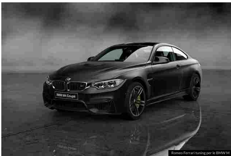
Romeo Ferrari tuning per le BMW M