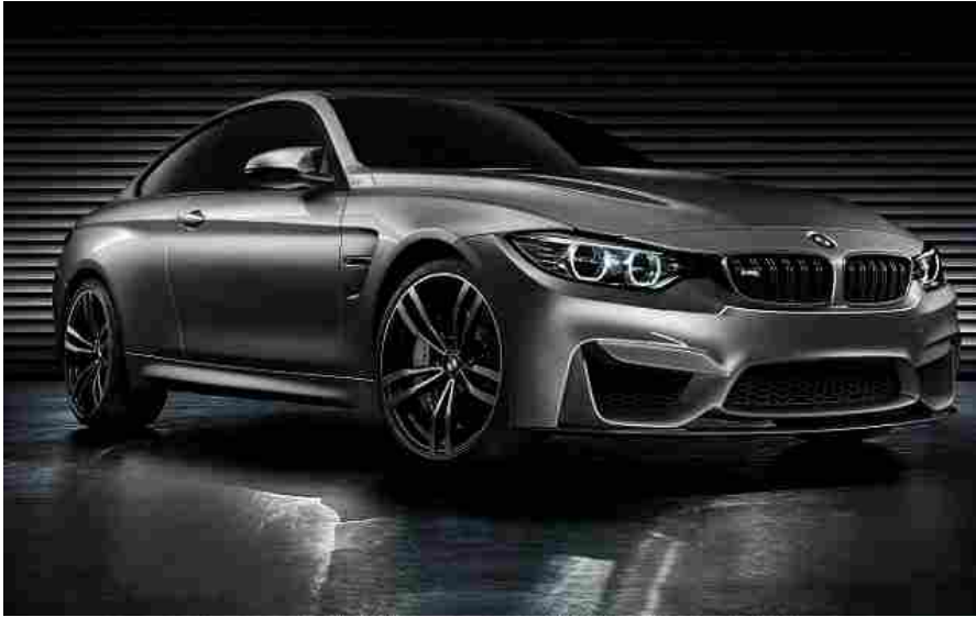
Romeo Ferrari tuning per le BMW M