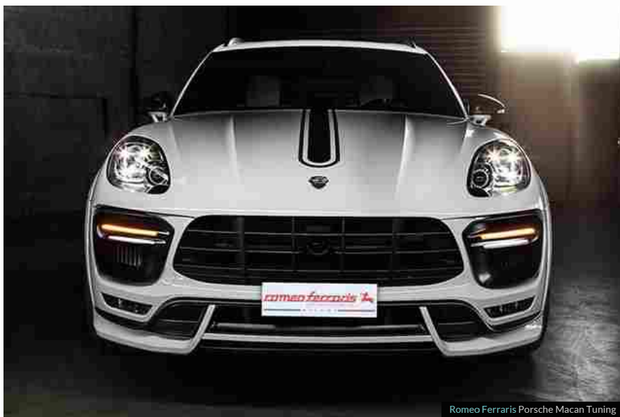
Romeo Ferraris Porsche Macan Tuning