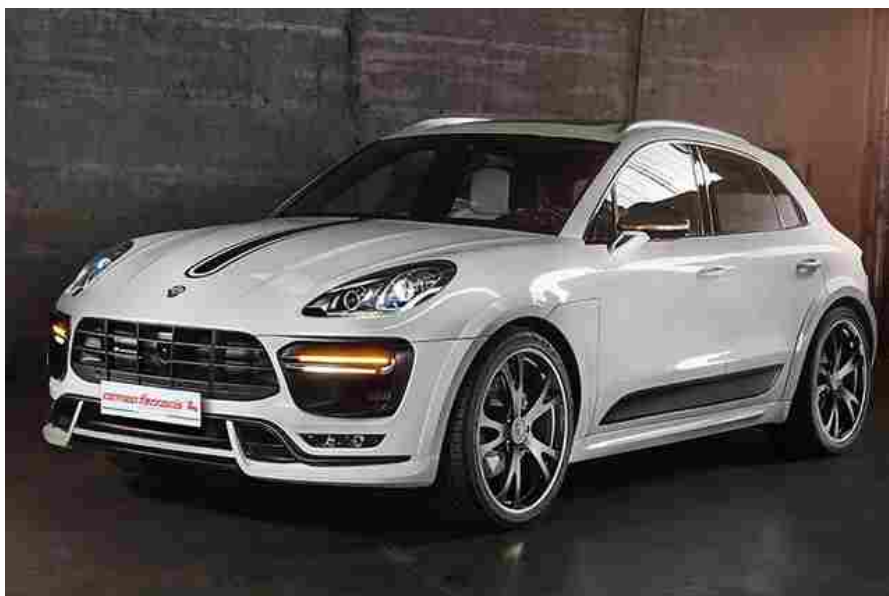
Romeo Ferraris Porsche Macan Tuning