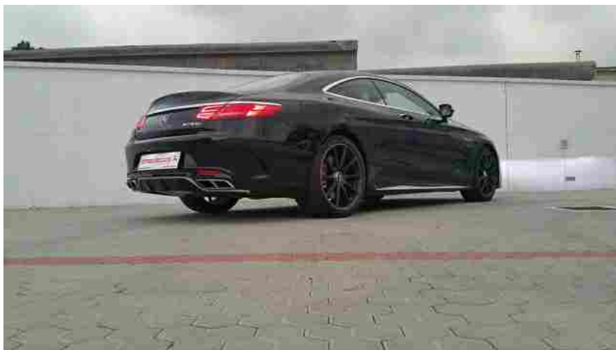
Romeo Ferraris personalizza le Mercedes AMG S65 AMG