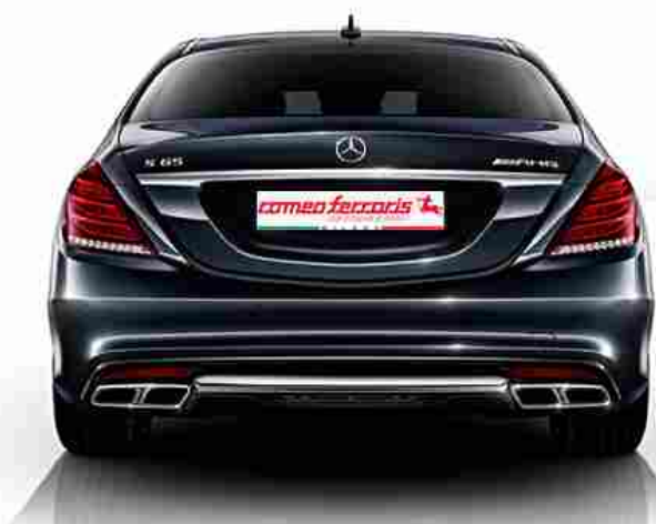
Romeo Ferraris personalizza le Mercedes AMG S65 AMG