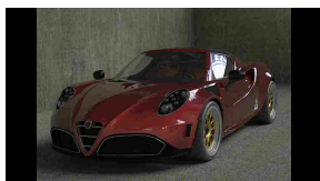
Alfa Romeo 4C, iniezione di potenza da Romeo Ferraris