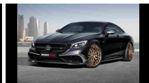
Brabus 850, Mercedes S63 AMG da 850 cv