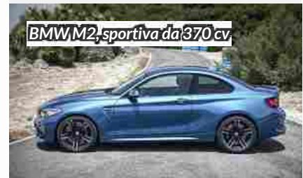
BMW M2 sportiva da 370 cv