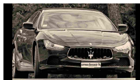
Maserati Ghibli elaborazione Romeo Ferraris