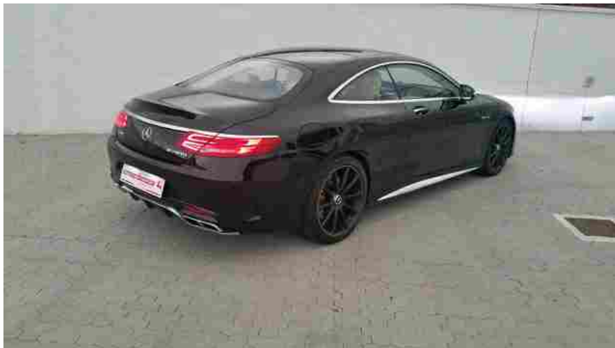
Romeo Ferraris personalizza le Mercedes AMG S65 AMG