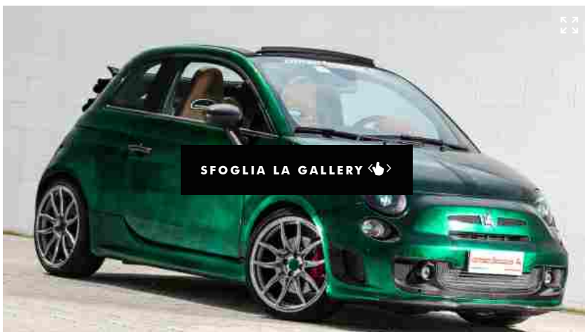
01/13 Romeo S

Non parlare mai di tuning all'interno dell'officina con oltre 50 anni di storia di Romeo Ferraris : qui si parla di personalizzazioni,