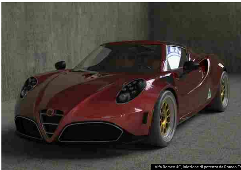
Alfa Romeo 4C, iniezione di potenza da Romeo Ferraris