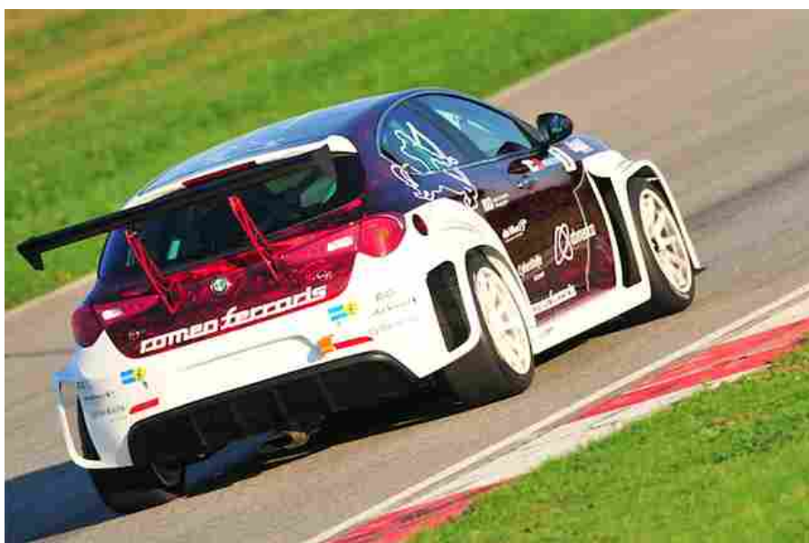
Giulietta TCR Romeo Ferraris