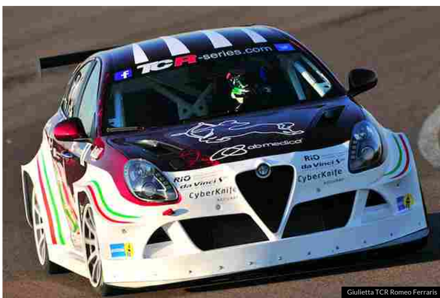
Giulietta TCR Romeo Ferraris