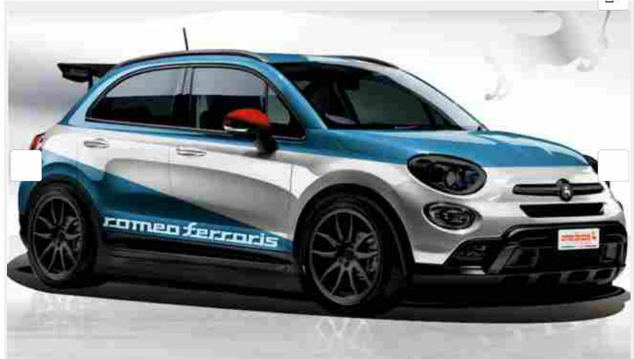
La Fiat 500X ribassata con il kit di personalizzazione omeo Ferraris