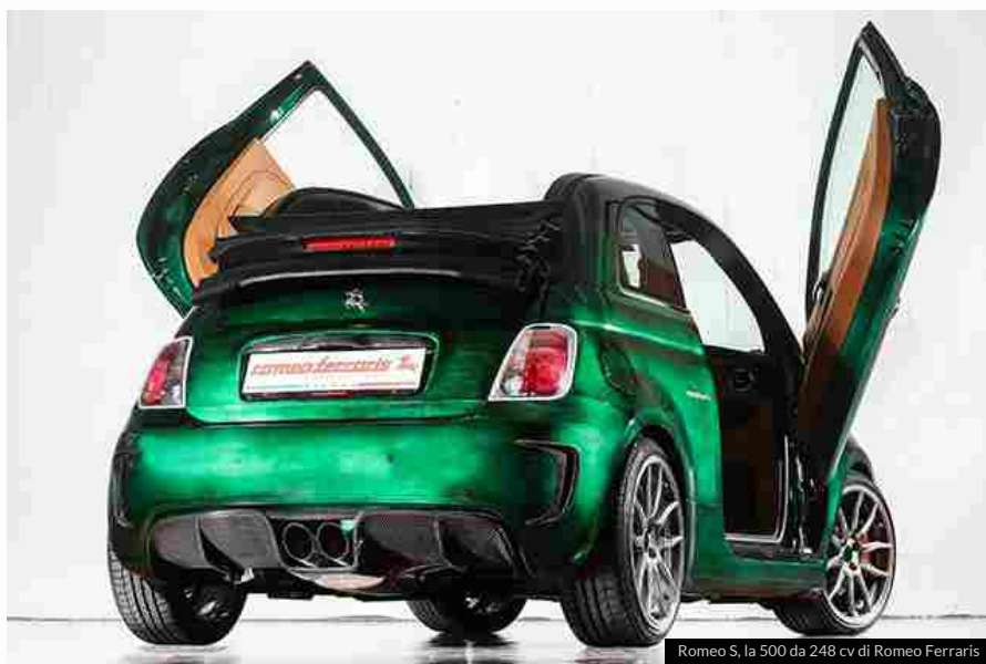
Romeo S, la 500 da 248 cv di Romeo Ferraris