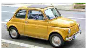
Cerchi l'auto dei tuoi sogni? Scopri oltre 350.000 occasioni per risparmiare su Subito.it

Studiante guadagna più di 120 € al giorno con questo trucco (rischio di mercato)