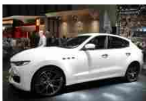
Maserati Levante, prezzo da a 73.417 euro

Al top i 91.358 euro per la Levante S da 430 cavalli. Commercializzazione a maggio.