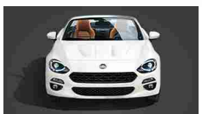
Fiat 124 Spider

Van o bus, omologato N1 o M1, il furgone elettrico propone una versione specifica per il settore noleggio