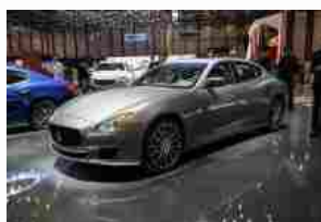
Maserati bene a febbraio 2016

Al top i 91.358 euro per la Levante S da 430 cavalli. Commercializzazione a maggio.