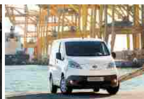
Nissan e-NV200, prezzo. Novità Elite Limited Edition

Ottime performance ottenute in Germania con una crescita del 47%, in Svizzera con + 29% e in Francia con + 40 %