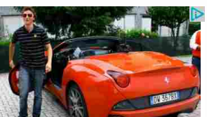
Per saperne di più.

Grandi Vini premiati con i 3 Bicchieri del Gambero Rosso