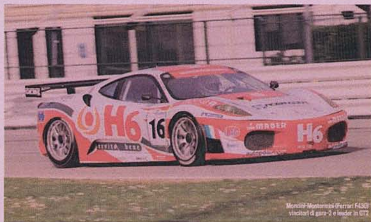
Moncini-Montermini (Ferrari F430) vincitori di gara-2 e leader in GT2

A Misano un successo a testa per il Cavallino e la Casa tedesca, che monopolizzano GT2 e GT3